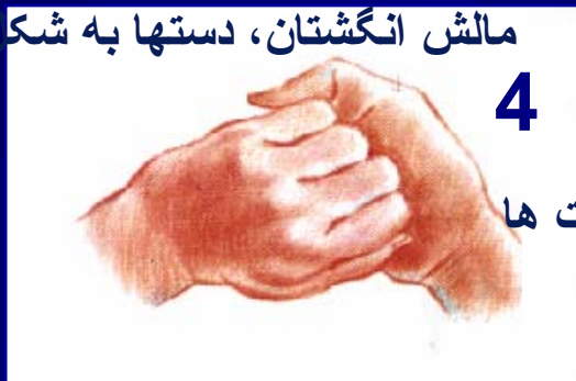
مالش انگشتان، دستها به شکل