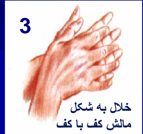
خلال به شکل مالش کف با کف