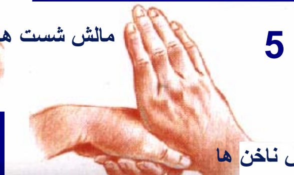
مالش ناخن ها