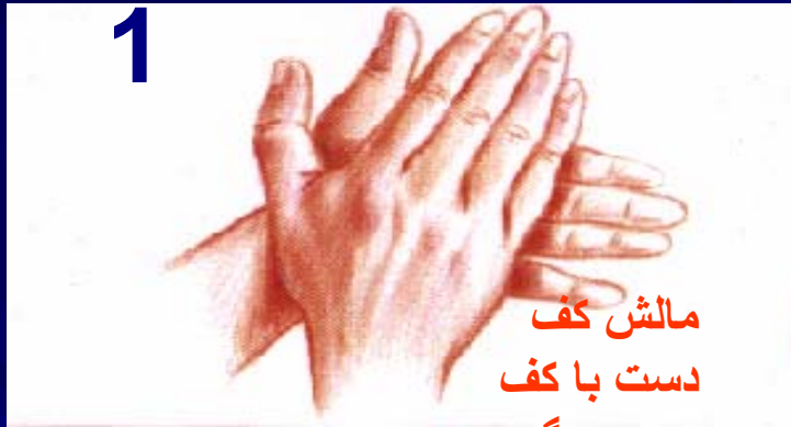
مالش کف دست با کف دست دیگر