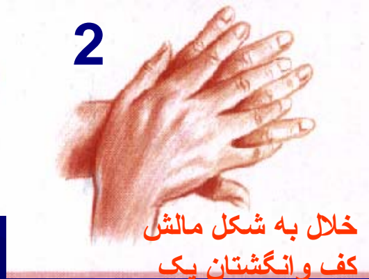
خلال به شکل مالش کف وانگشتان یکی دست بر پشت وانگشتان دست دیگر